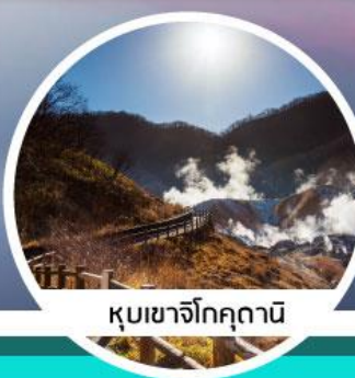
ภูเขาจิกคุดาบิ