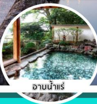
ออนน้ำแร่