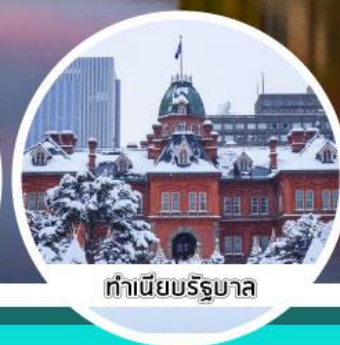
ทำเนียบรัฐบาล