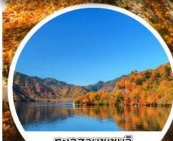
ทะเลสาบชูเซนจิ

24 / 25 / 26 / 27 ก.ย.62 28 / 29 / 30 ก.ย.62 1 / 2 / 3 / 4 / 5 ต.ค.62 6 / 7 / 8 / 9 / 10 ต.ค.62 11 / 12 / 13 / 14 ต.ค.62 15 / 16 / 17 / 18 ต.ค.62 19 / 20 / 21 / 22 ต.ค.62 23 / 24 / 25 ต.ค.62